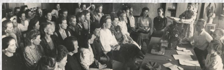
Совещание библиотечных работников