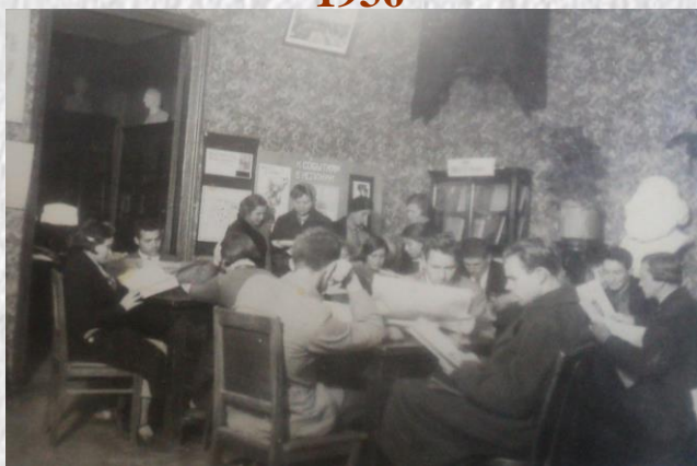
В читальне Рязанской губернской библиотеки. Всеобуч