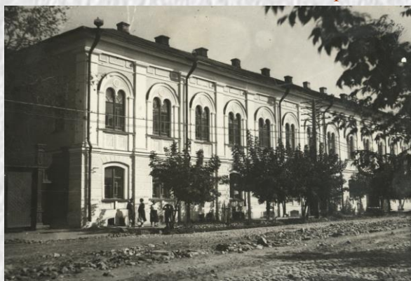
Библиотека размещалась в этом здании с октября 1922 г. до конца 1950 –х годов