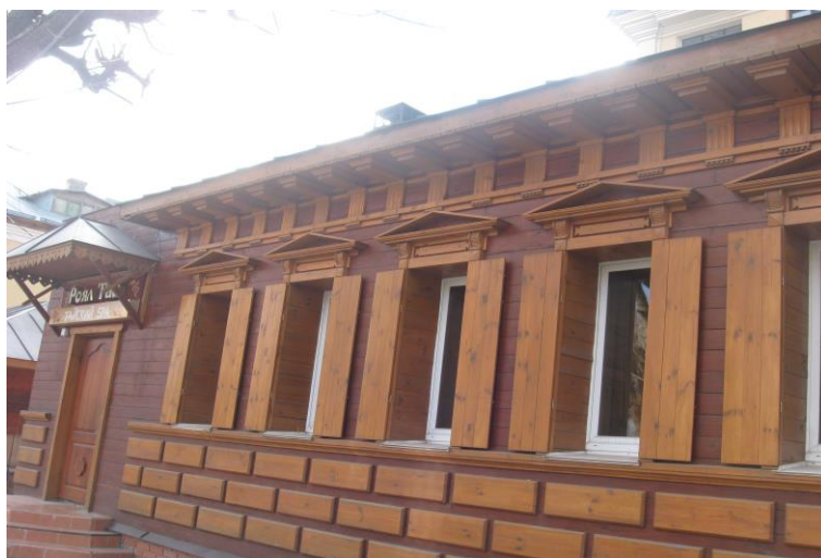
Рис.3 Ул. Салтыкова-Щедрина, д.17 является одним из немногих, оставшихся в Рязани произведений деревянного классицизма.

Основные принципы этого закона состоят в следующих моментах. Во-первых, застройщики обязывались, чтобы в середине фасада было окно, а не простенок, а строения имели одно, три, пять, семь или более (непарное число) окон (рис. 3). Во-вторых,