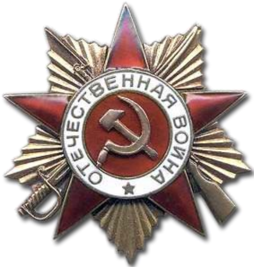
Рис.5 (орден Отечественной Войны I степ.)