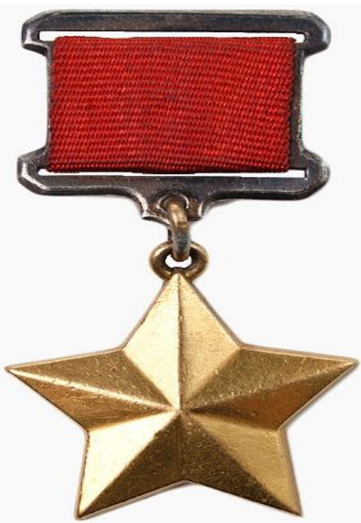
Рис.3 (медаль «Золотая Звезда»)