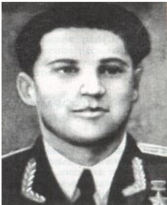
Рис.1 (Азовкин Ю.П.)