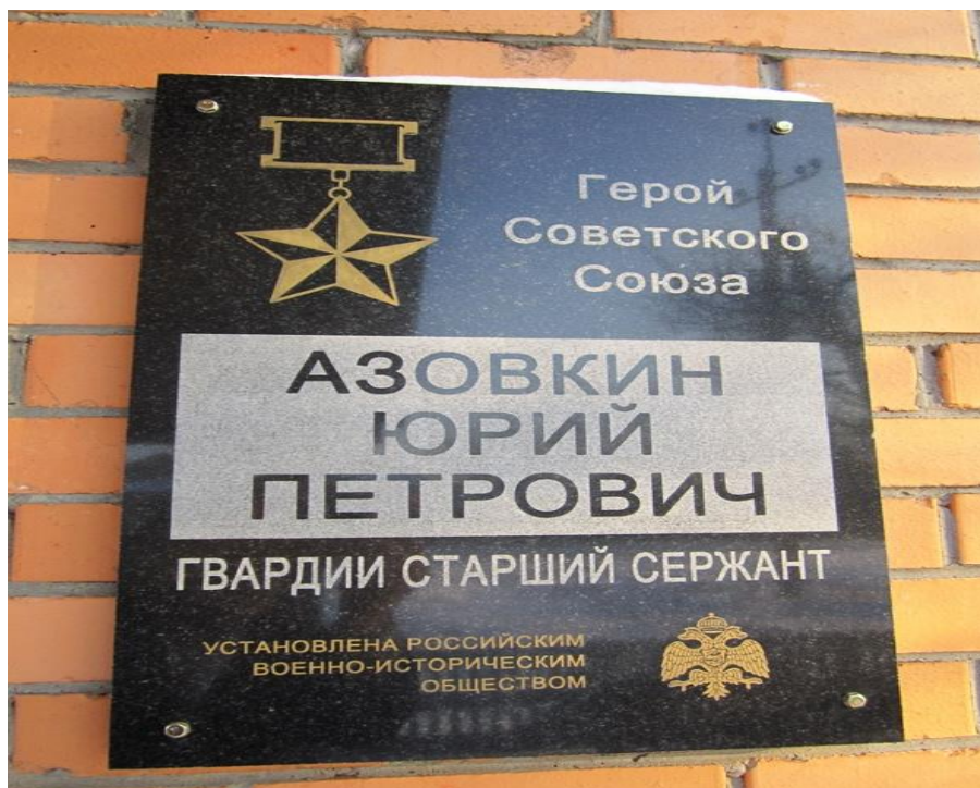
Рис.10 (Мемориальная доска на здании городской библиотеки №38)