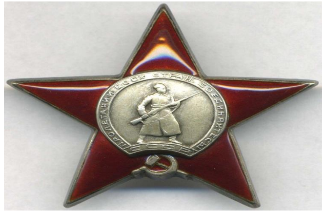
Рис.6 (орден Красной Звезды)