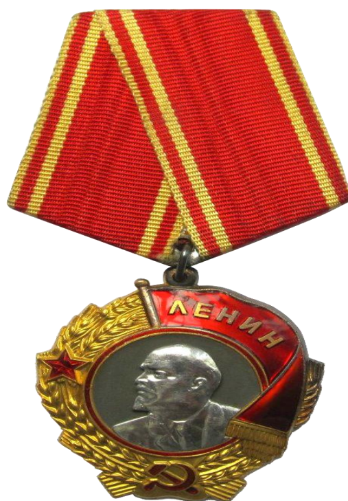
Рис.4 (орден Ленина)