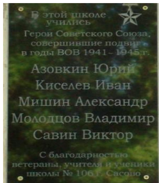
Рис.8,9 (Мемориальная доска в Сасово на здании школы №106)