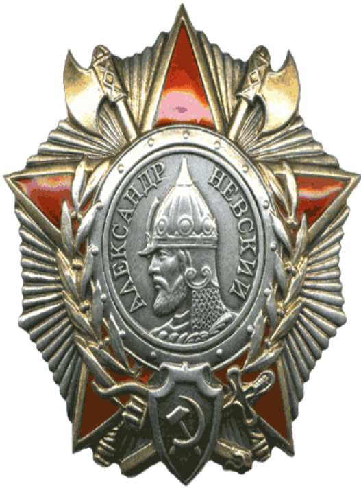
Рис.7 (орден Александра Невского)