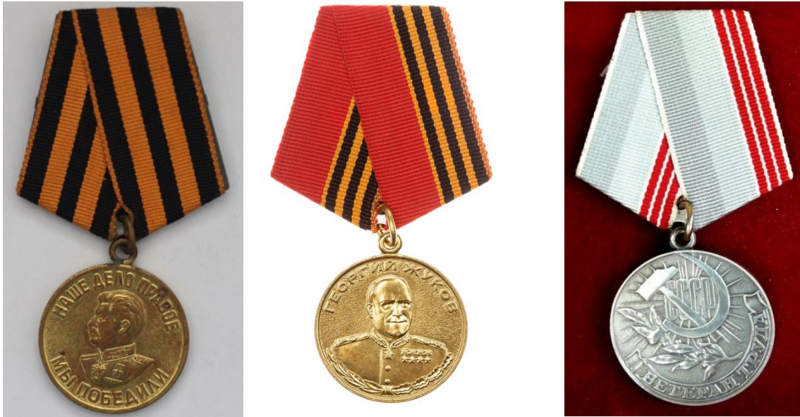
Рисунок 1 – Награды Волчкова Д.М.

Дмитрий Матвеевич был курсантом при школе связи на командирском отделении связи. В 1942 году дивизия выступила на фронт под город Воронеж. Там стояли в обороне до 1943 года. В наступление пошли зимой 1943 года. Дошли до реки Сейм и опять находились в обороне до Киевского наступления. Киевская оборонительная операция (13 ноября — 22 декабря 1943). Операция проводилась с целью отражения контрнаступления немецких войск на киевском направлении.