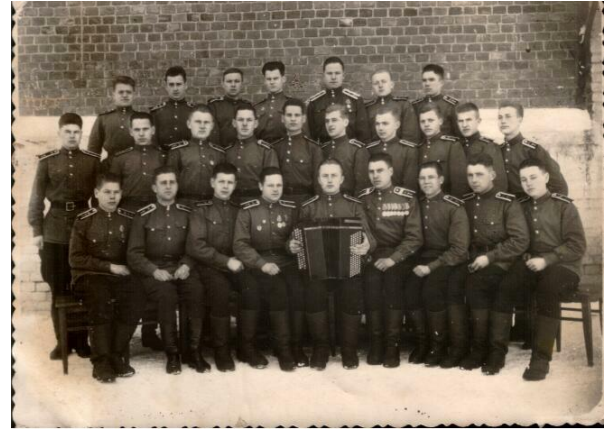
Рис.6. В Тамбове