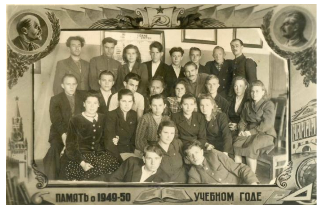
Рис.8. Обучение в Москве