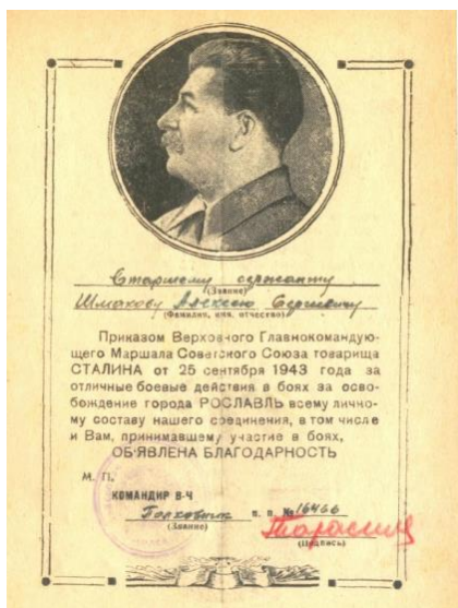
Рис. 1. Благодарность за освобождение г. Рославль

После разгрома гитлеровцев под Сталинградом зачислен в 31 артиллерийский полк 49-ой стрелковой дивизии помощником командира взвода. В этом полку прадед воевал вплоть до мая 1945 года (приложение 1). Его боевой путь шёл через г. Калугу, г. Сухиничи (был ранен и с 6.03 по 26.03 1943 года был в городском госпитале), Жиздру (был снова ранен и лежал в госпитале №654 с 12.04 по 8.05.1943 года), г. Рославль (25.09.1943 года была объявлена благодарность Приказом Верховного Маршала Советского Союза от 25.09.1943г. за освобождение города (рис. 1), г. Могилёв, г. Рогачёв, г. Бобруйск, г. Вильно, г. Каунас, г. Белосток, г. Брест, г. Холм, г. Люблин, г. Варшаву (снова ранение и нахождение в госпитале с 17.01 по 6.02.1945 г. в госпитале №4866 (рис. 2); получил медаль «За освобождение Варшавы» А №002903), г. Брисков, г. Потсдам (приложение 2).