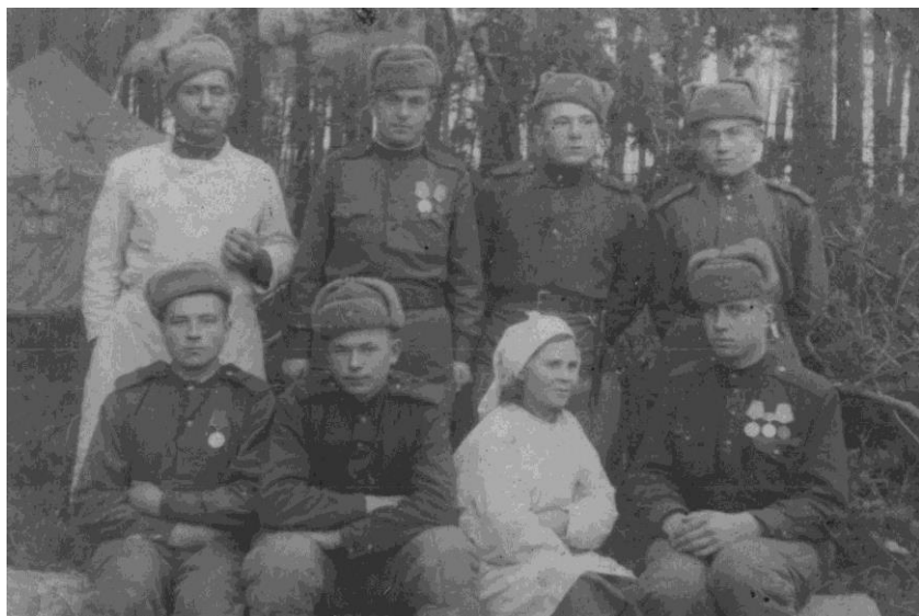
Рис. 2. В полевом госпитале

В составе 1-го Белорусского фронта участвовал в штурме Берлина. 2.05.1945 года был тяжело контужен и отправлен в госпиталь УгПЭП г.