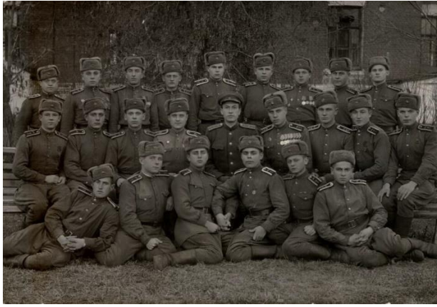
Рис.5. В Ленинграде