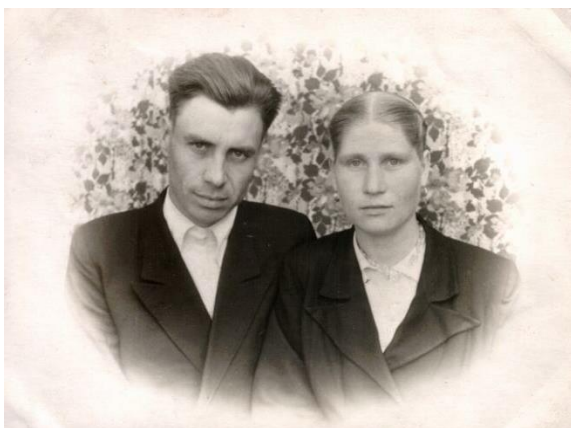
Рис.7 Семья Шмаковых

В 1949 году прадед решил получить гражданскую специальность и поступил в Московский политехникум Министерства заготовок СССР на специальность механик мукомольной промышленности (рис. 8). После его окончания был распределён в Москву, но настоял на переводе на родную Рязанщину (добился через аудиенцию с министром сельской промышленности РСФСР). Был направлен в Ряжск, а затем в Александровский. В 1963 году перебрался в Рязань, где работал мастером на заводе ТКПО до пенсии.