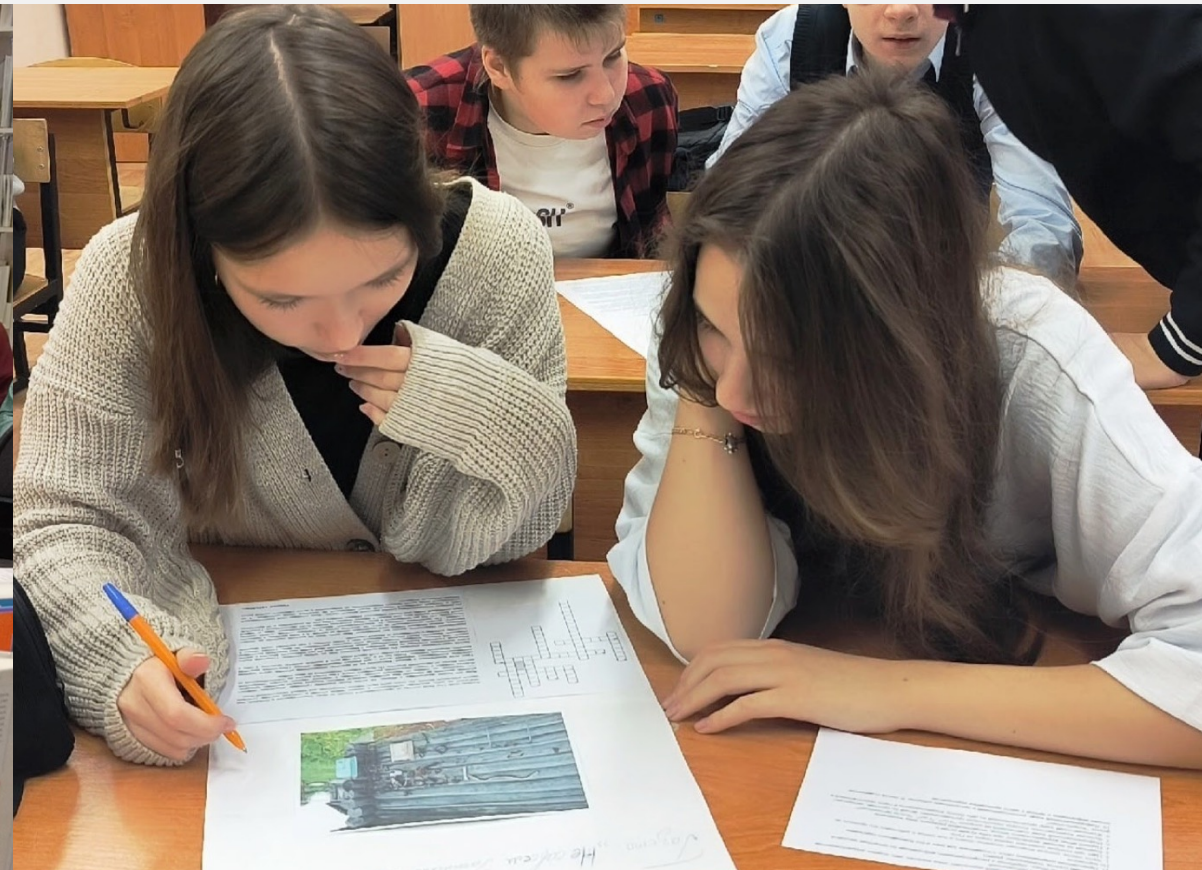
Центральная библиотека межпоселенческого МБУК ЦРБ Гагинского муниципального округа (Нижегородская область)