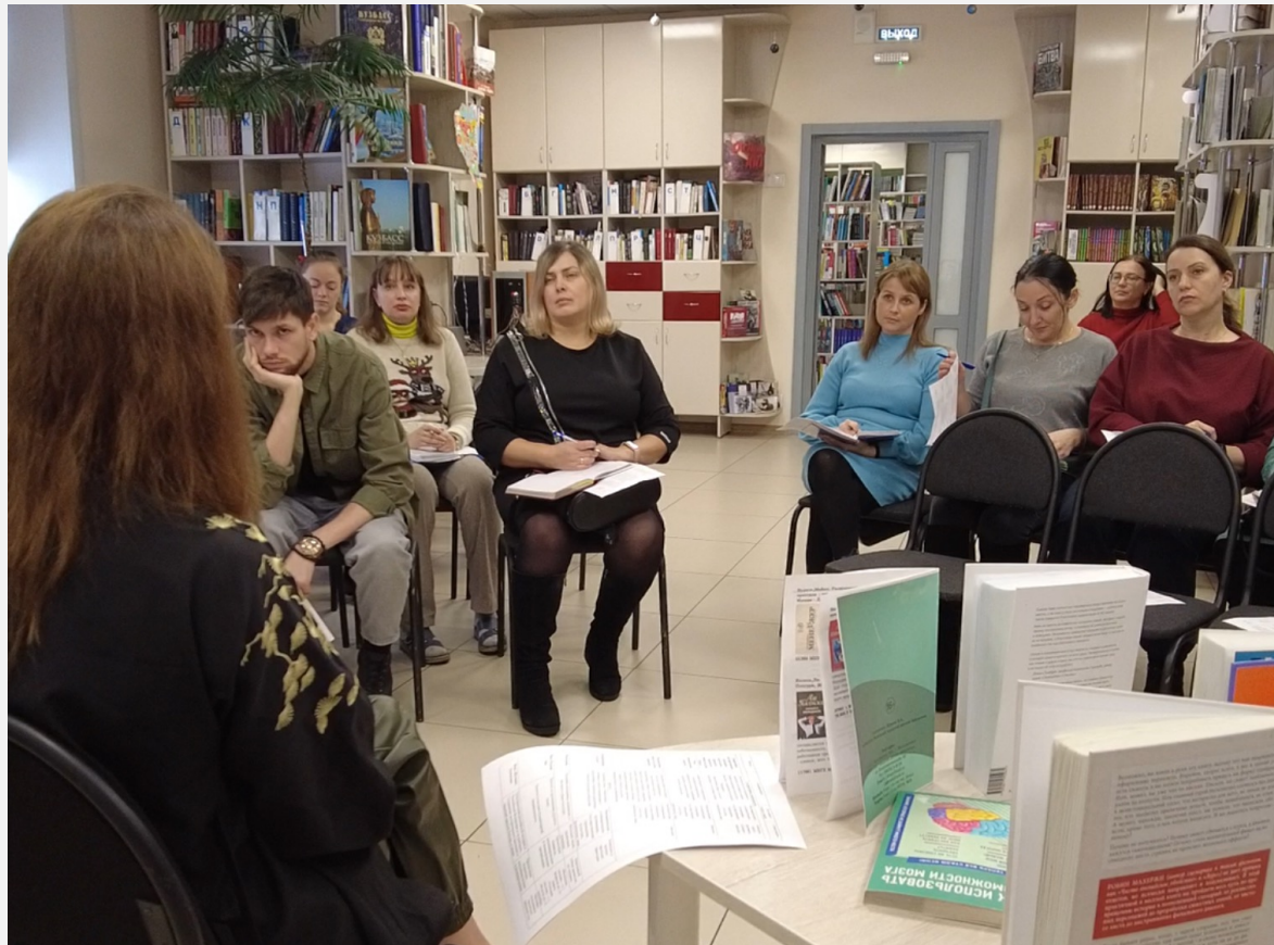
Модельная городская детская библиотека МБУК «Междуреченская Информационная Библиотечная Система» (Кемеровская область)