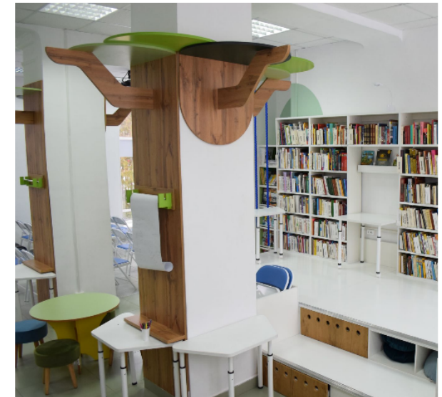
Дизайн библиотечного пространства