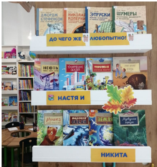
Формирование фонда библиотеки