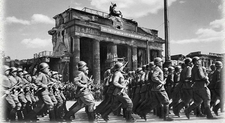
Парад 4 мая в Берлине