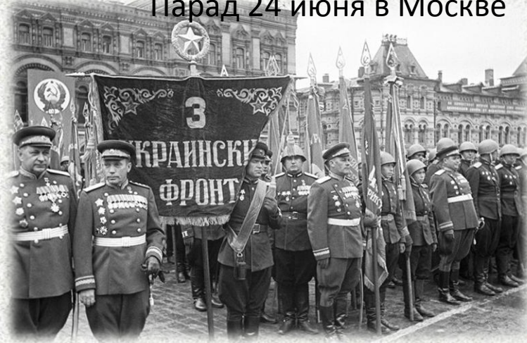
Парад 24 июня в Москве